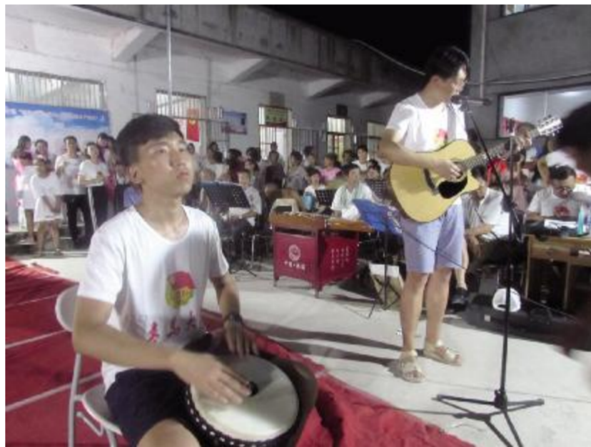
大学生暑期“三下乡”活动。