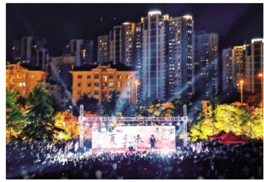
青岛大学“夏至未至”首届校园音乐节近日在海月广场举行。来自全校的歌手、舞团、乐队联袂献上视听盛宴,现场气氛热烈,观众参与积极,为青大学子打造了一个展现自己的舞台,也在炎炎夏日为广大学生带来了青春的活力与激情。