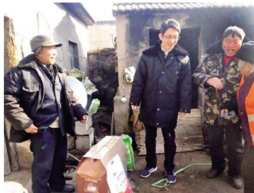
省驻村工作队队员开慧在年底看望慰问困难群众。