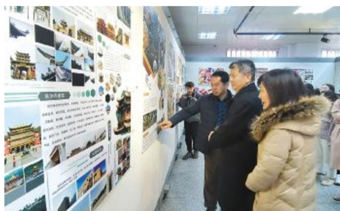
图为“大美之行——西行寻艺之旅”采风实践汇报展览中。