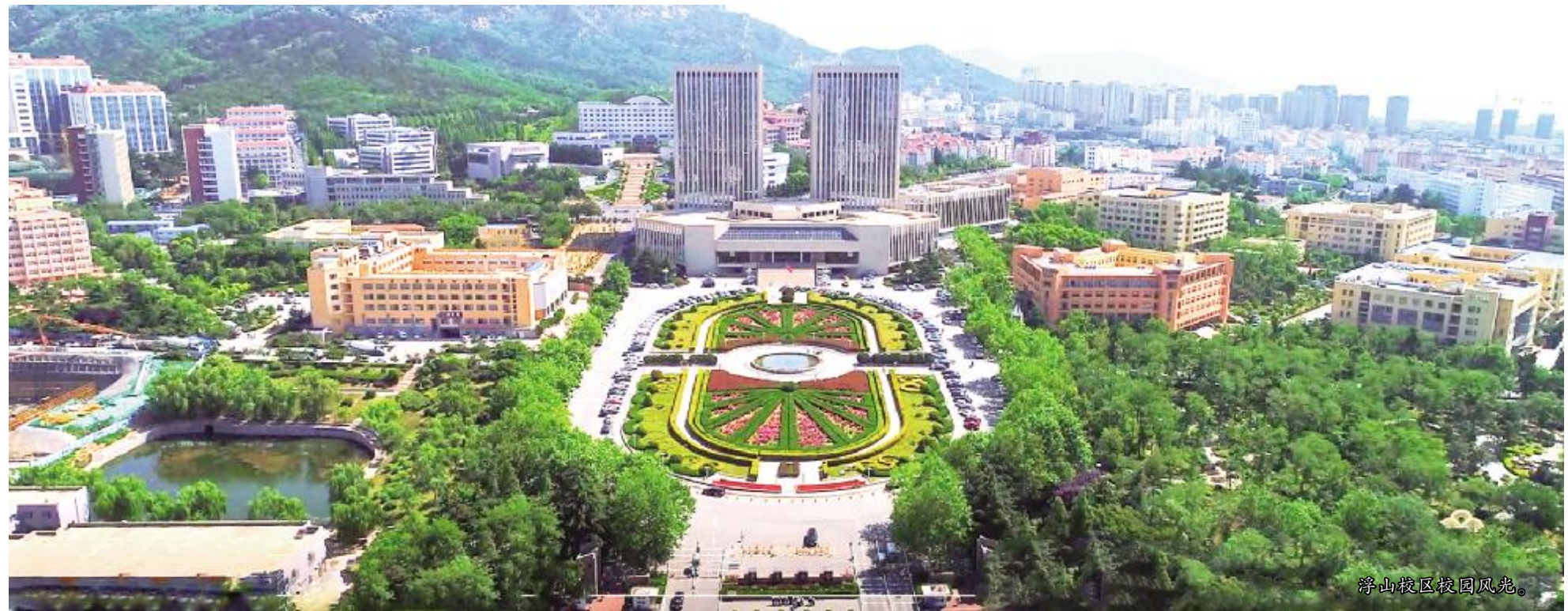
浮山校区校园风光。