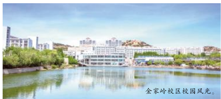
金家岭校区校园风光。