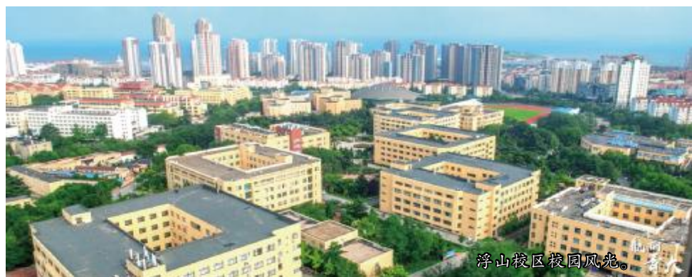
浮山校区校园风光。