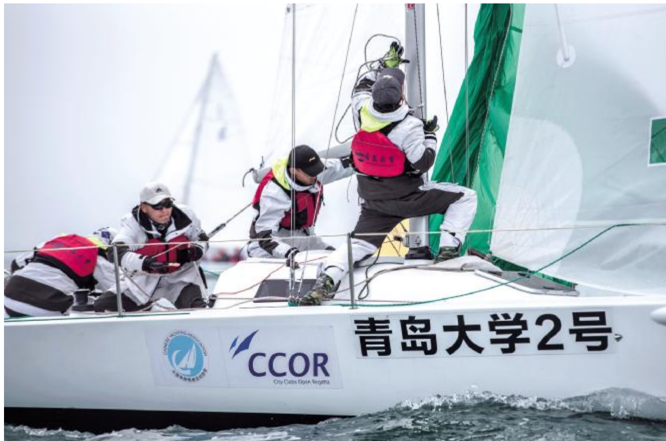
文 孙钰斐

CCOR是北方地区规模最大的国际性帆船赛事，由国家体育总局水上运动管理中心、中国帆船帆板运动协会、国际FE28级别协会及青岛市重大国际帆船赛事(节庆)活动组委会联合主办。