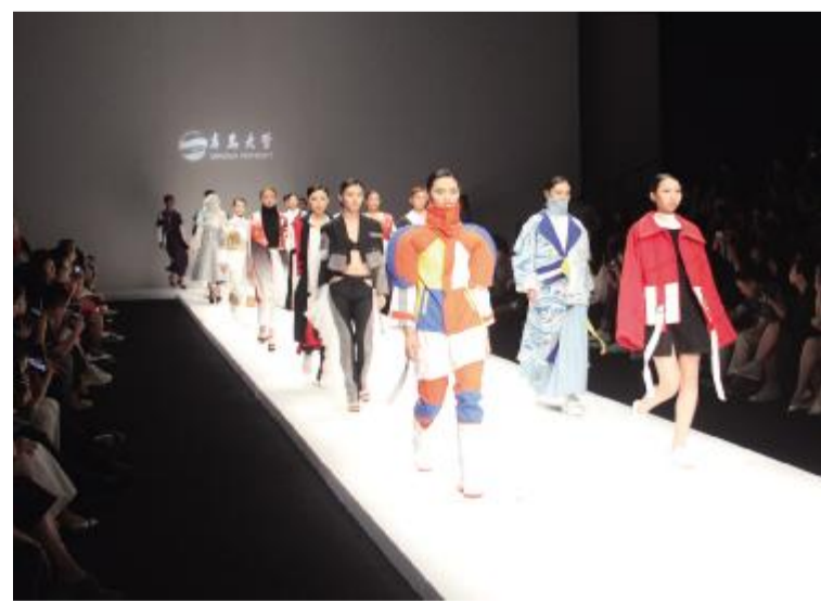
我校学子优秀作品亮相中国国际大学生时装周。

本报讯 5月14日,纺织服装学院服装与服饰设计系优秀毕业生作品亮相2019中国国际大学生时装周。在北京751D.PARK第一车间的T形台上,在绚丽灯光的衬托下,学子们向观众展示了《Ocean》《无塑海岸》等十多个系列的新品服装,赢得了现场观众的阵阵惊叹和热烈掌声。